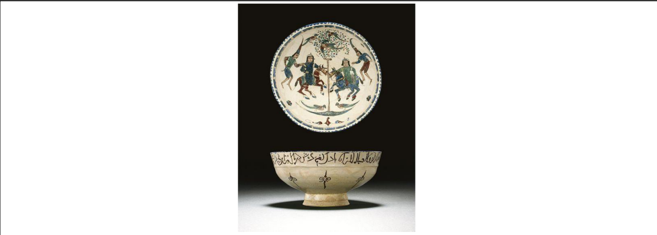
Fotoğraf 6. Minai Kâse, 13. yy., İran-Kaşan

Minai kaplarda en çok sarayla ilgili sahneler tasvir edilmiştir. Etrafında yaverleri veya müzisyenlerle tahtında oturan hükümdar, Şehname ‘den sahneler, atlı delikanlı ve hanımların resmedildiği figür grupları seramik kapların yüzeyinde yer alırlar. En çok sevilen sahne ise, yine aynı teknik ve stilde işlenen, iki atlının bir ağacın altında karşılaşmasıdır (Ögel, 2003: 234) (Fotoğraf 6).