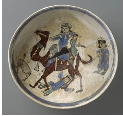
Fotoğraf 14. Behrâm-ı Gûr ve Azade Minai Seramik Kâse, 12.yy-13.yy, İran., Yükseklik 10.2 cm., çap 21.1cm.