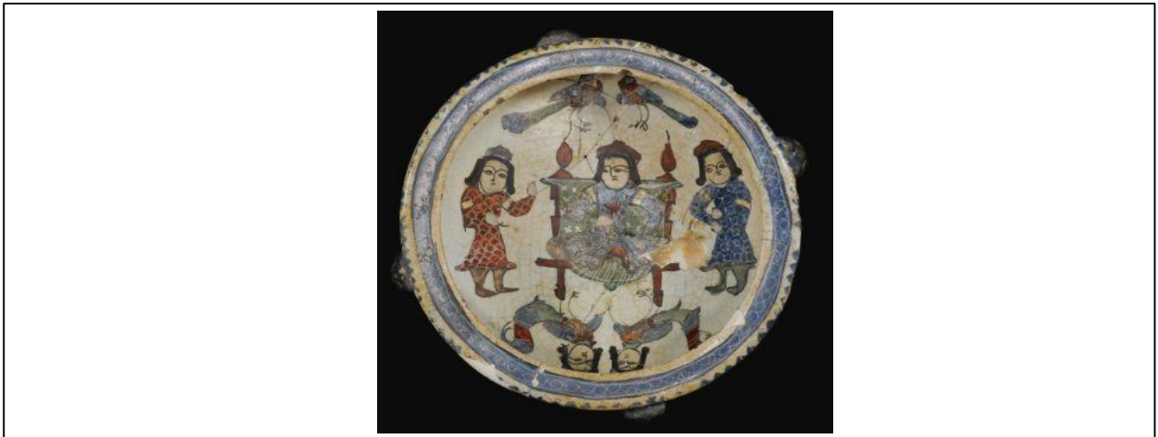
Fotoğraf 2. Figürlerle Süslenmiş Minai Çanak, 12. yy.- 13.yy., İran

İslam seramik sanatında süsleme yani dekor ön planda olurken kaplardaki form ikinci plandadır. Bu durum İslam sanatının diğer kollarında olduğu gibi süslemenin çok önemli olduğunun göstergesidir. İslam seramik sanatında yüzeylerde uygulanan süsleme, desen, konu ve kompozisyon hatta renk incelendiğinde, dönemin el yazması eserlerinde rastlanan minyatür sanatına en yakın süsleme tekniği olarak minaili seramik kaplar karşımıza çıkar. 12. yüzyıldan 14. yüzyıla kadar gelişimini sürdüren ve özellikle Kaşan bölgesinde lüster-