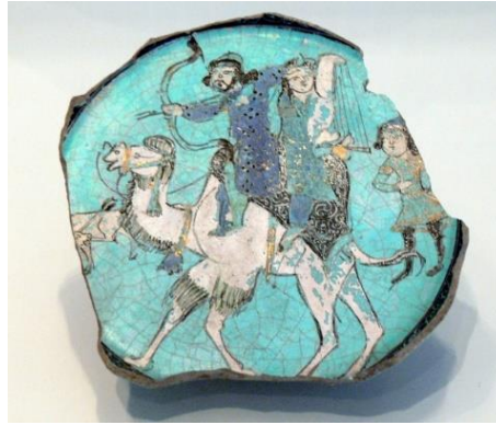
Fotoğraf 15. Behrâm-ı Gûr ve Azade Minai Seramik Kâse Parçası, 13.yy., İran, Kaşan.