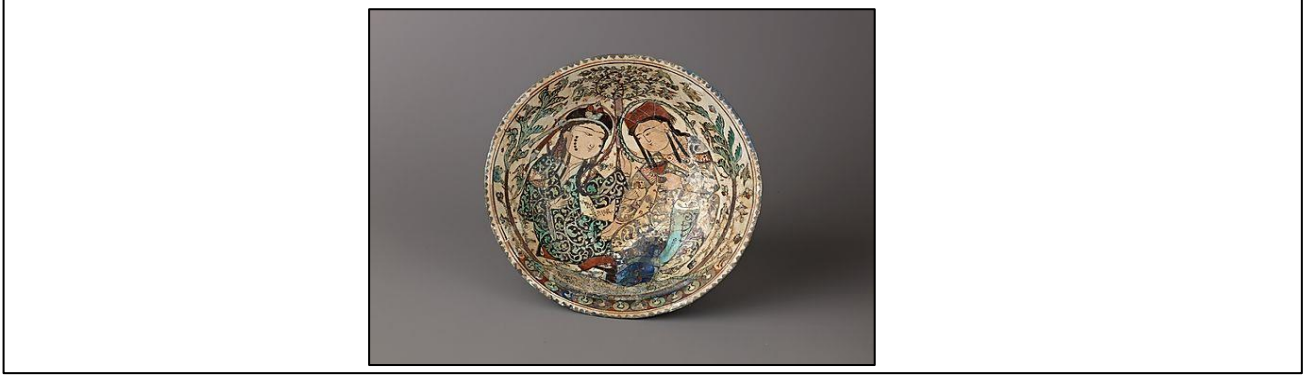
Fotoğraf 3. Minai Çanak, 12. yy. sonu-13. yy. başı, Orta İran Bölgesi, Çap 18.8cm.

Selçuklu döneminde halk ve aşk temalı öykülerle birlikte özellikle kahramanlık hikâyelerini anlatan edebi eserlerin okunması ve anlatılması oldukça yaygındı (Fotoğraf 3). Bu eserlerdeki kahramanların ve öykülerin resmedilmesi dönemin adeta bir geleneği haline gelmişti. Dönemin el yazması kitaplarındaki metinleri anlatan resimlerdeki figür ve kompozisyonlarla canlandırılan sahneler, seramik kaplarda olduğu gibi madeni kapların yüzeylerinde de uygulanmıştır (Avşar&Avşar, 2015: 108).