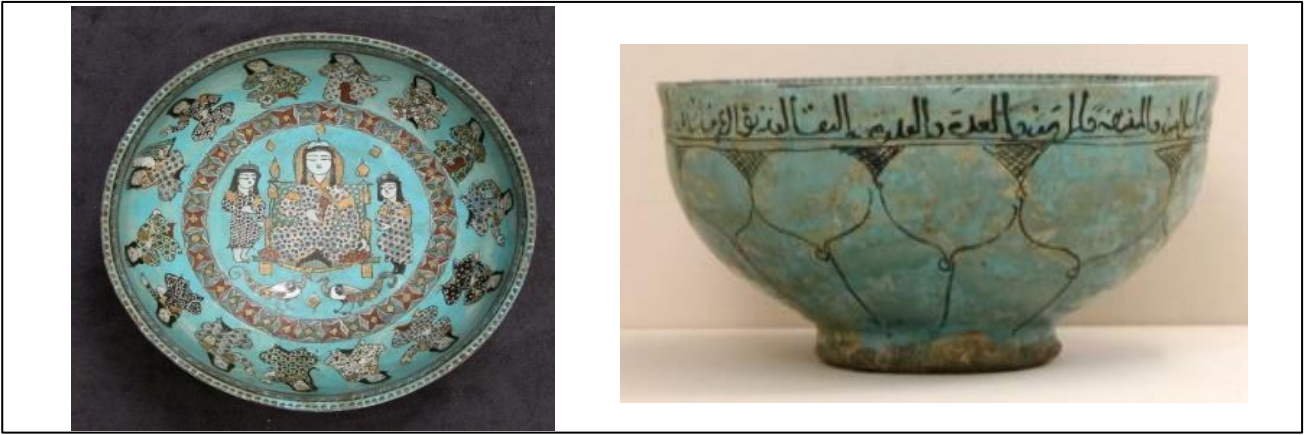
Fotoğraf 1. Turkuaz Sırlı Minai Kâse, 12.- 13.yy. İran. Yükseklik 8.3cm, Ağız çapı 18.7cm.

Büyük Selçuklu dönemi çini ve seramik üretiminde Rey ve Kaşan en önemli imalat merkezleridir. Özellikle lüster gibi en dikkat çeken tekniğin uygulandığı bu dönemde minai tekniğini keşfetmeleri, bu merkezleri daha da tanınır hale getirmiştir. Minyatür sanatı ile yakın ilgisi olan bol figürlü minai seramikler, Selçukluların kıyafetlerini, tiplerini ve o zamanki günlük hayatlarını canlandıran konuları ele almıştır (Aslanapa, 1989:328) (Fotoğraf 1, Fotoğraf 2).