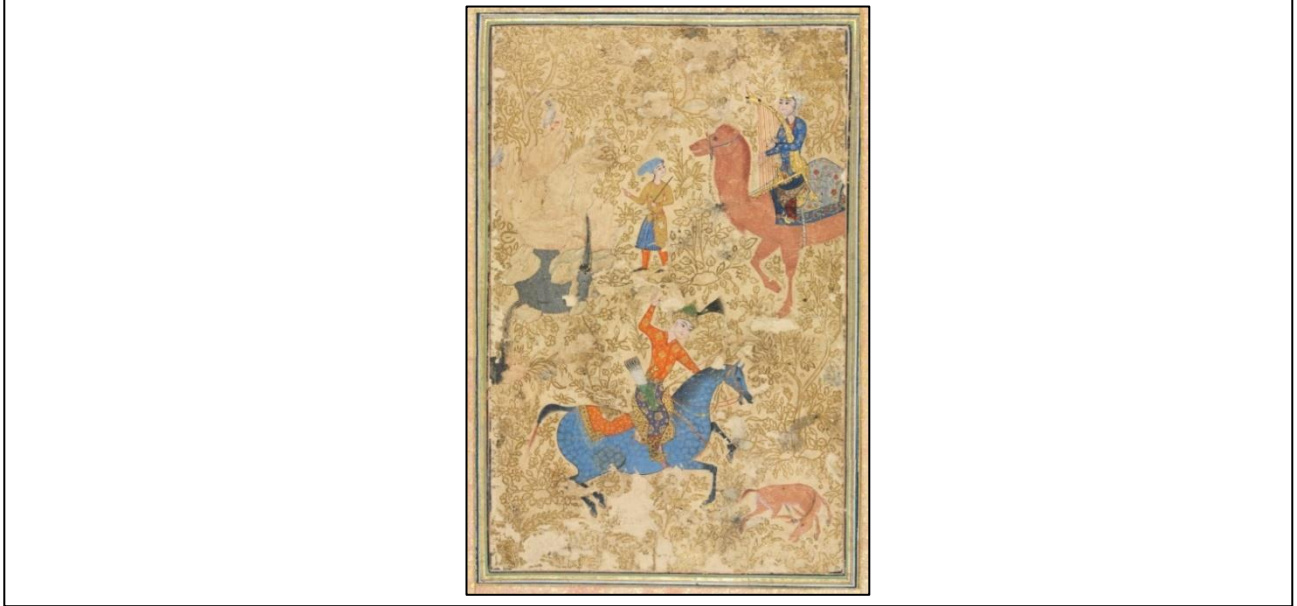
Fotoğraf 7. Minyatür, Behrâm-ı Gûr ve Azade, Av Sahnesi, Firdevsi'nin bir Şahnamesinden (Krallar Kitabı) Bahram Gur ve Azada, İran, Tebriz veya Kazvin, Safevi dönemi (1501-1722), Boyut: 32,5 x 21,5 cm.

Behrâm-ı Gûr ve Azade'nin hikâyesi çok uzun bir geçmişe sahiptir. İslam öncesi döneme kadar uzanır. Birkaç minai kâsede ve daha çok metal ve madeni kaplarda işlenmiştir. Bu hikâye 10.yy. sonlarından önceki metinlerde bilinmemekle birlikte, Sasaniler döneminde ve onu takip eden İslami yönetimin olduğu dönemlerde popüler olmuştur. Kaynaklara göre Şehname adlı eser, "Krallar Kitabı" olarak bilinen bir Pehlevi (Orta Farsça) eserin çevirisidir. II. Hüsrev (M.S. 590-628) dönemine kadar uzanmaktadır. Bu eser Sasani dönemi tarihsel bilgilerini içermektedir. Firdevsi tarafından M.S.977-1010 tarihleri arasında yazılan Şehname, içinde bu hikâyenin de yer aldığı, eski İran efsaneleri üzerine kurulu manzum destandır ( https://stringfixer.com/tr/The_Shahnameh ) 3 . (Fotoğraf 7-8)