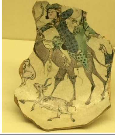
Fotoğraf 13. Behrâm-ı Gûr ve Azade Minai Seramik Parçası, Yükseklik 9.2 cm., çap 21.3cm.