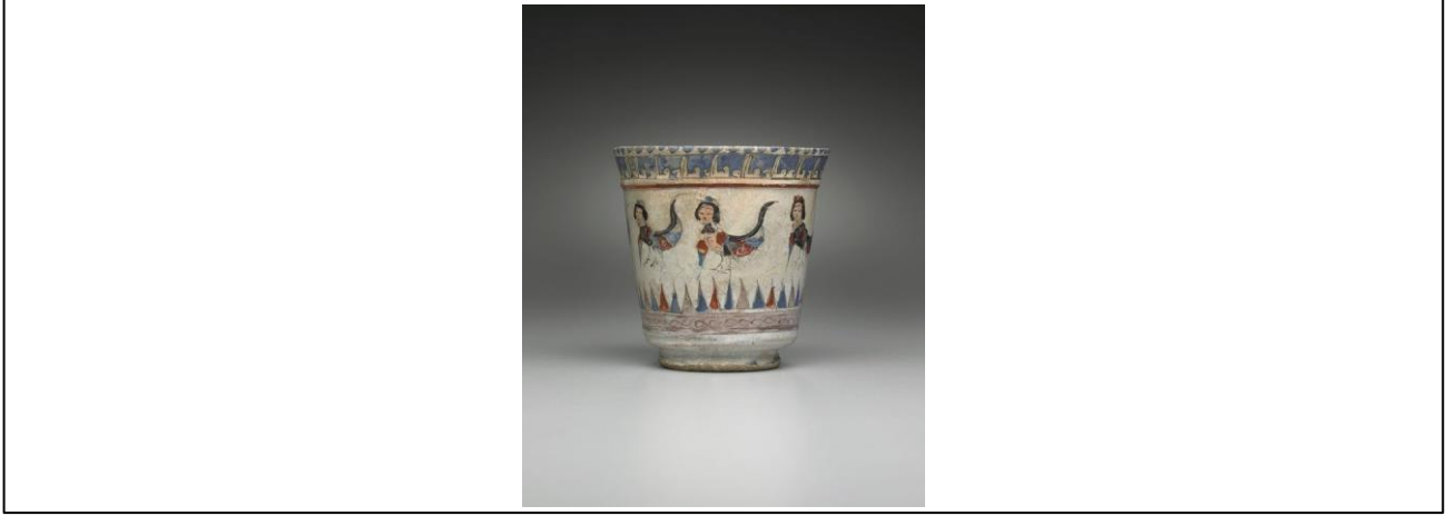
Fotoğraf 5. Minai Kadeh, Beyaz Opak Sır Üzerine Polikrom Renkli, Fritware, 12. yy. sonları, İran-Kaşan, çap 18.8cm.

Öte yandan dönemin seramiklerinde, yüzeyi süsleyen figürlü kompozisyonlarda saray sahneleri, saray yöneticileri ve hizmetçileri ya da Pers efsaneleri ve av sahneleri gibi konular anlatılırken, diğer bazı seramik kap örneklerinde ise, sadece arabesk ve geometrik desenler yer almaktadır. Minaii üretimin en iyi örnekleri Rey bölgesinde görülmektedir. Kaşan ve Sava gibi seramik merkezlerinde de minai tekniği ile ürünler üretilmiş fakat Rey bölgesinin kalitesi yakalanamamıştır (Charleston, 1977:85). Rey bölgesinde yapılan seramik ve çinilerde çizgisel hattatlık özellikle resmedilen figürlerde ön plandadır. Bu bölgede üretilen kaplarda İranlı ya da Selçuklu tipi ay yüzlü insan figürleri, Selçuklu tarzının karakteristik özelliklerini yansıtır. Ayrıca Rey’de üretilen seramik ve çini formların kompozisyonlarında, bordür şeklinde etrafına yazılan şiirler de dikkat çekicidir. Ömer Hayyam, Nizami, Sadi ve Firdevsi gibi dönemin ünlü şair ve edebiyatçıların Farsça eserlerinden mısralar ve satırlarla bu kapların kenarları süslenmiştir. Minai tekniğiyle yapılan seramikler, olağanüstü özenli hazırlanmış minyatür uygulamaları ve kabartmalı-altın yaldızlı kap süslemeleriyle etkileyici olduğu kadar üretiminin maliyetli olması bakımından pahalı eserlerdir (Watson, 2004: 55). Eğlence sahneleri, süvariler, oturan ya da ayakta insan figürleri, av sahneleri, Şehnamelerden alınan hikâyeler, harpiller, çift başlı kuşlar, minai grubunun zengin repertuarını (Fotoğraf 5).