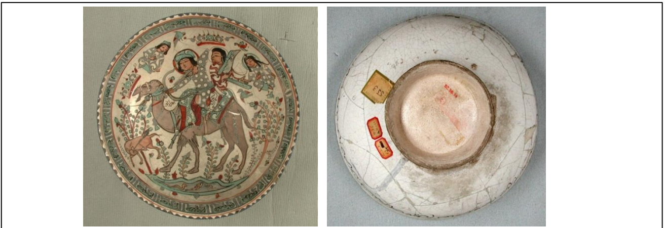
Fotoğraf 12. Behrâm-ı Gûr ve Azade Minai Seramik Kâse, 12.yy-13.yy, İran., Yükseklik 9.2 cm., çap 21.3cm.