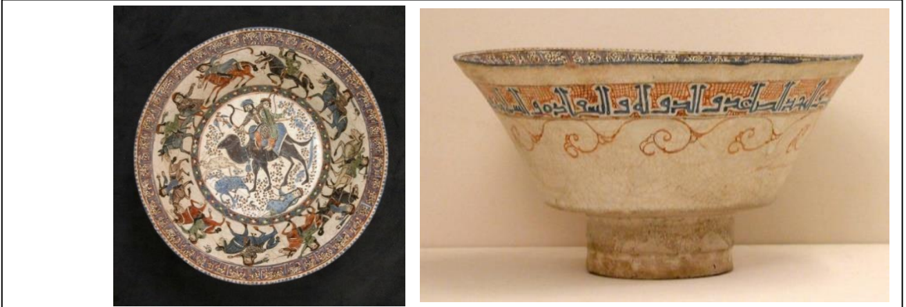
Fotoğraf 11. Behrâm-ı Gûr ve Azade Minai Seramik Kâse, 12.yy-13.yy, İran. Yükseklik 9.7cm., çap. 21.6cm.