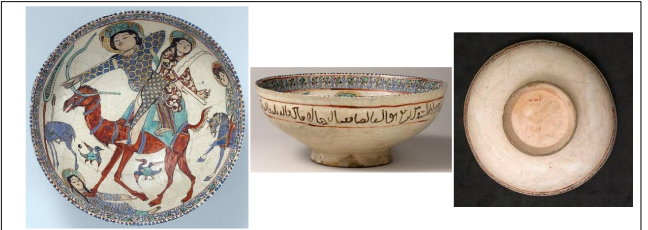
Fotoğraf 10. Minai Seramik Kâse, Behrâm-ı Gür ve Azade Av Sahnesi, 12. yy. sonu-13.yy. başı, İran-Kaşan

Seramik kâsede resmedilen bu kompozisyon minyatür geleneği gösteren minai tekniğinin tüm özelliklerini yansıtmaktadır. Kâsede mavi, turkuaz, kahverengimsi kırmızı ve siyah renkleri şeffaf sır altına, likit altın ise sırtüstüne uygulanmıştır. Bazı örneklerde sır üzerine altın yıldız uygulamaları da görülmektedir.